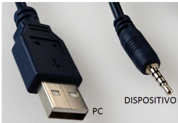
Imagen 1: Terminaciones del cable

Antes de descargar la información histórica de su dispositivo a su computador o antes de realizar la configuración del mismo, usted tiene que conectar el dispositivo al PC siguiendo los siguientes pasos: